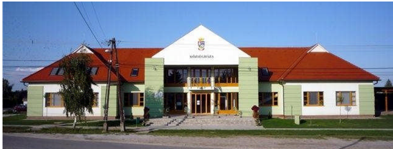
Az abdai Községháza, a konferencia helyszíne