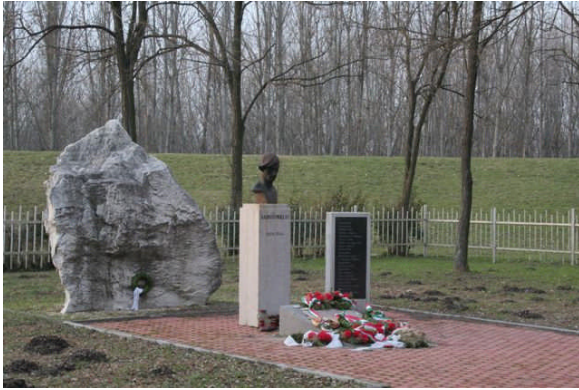
A Radnóti-emlékhegy Abdán, a Rábca-gátnál

A konferencián való részvétel ingyenes. Étkezést és szállást azonban csak az előadók számára tudunk biztosítani. Kérjük szíves megértésüket! A reggeli az előadók számára mindig a szállodában, a további étkezések a Községháza teraszán lesznek.