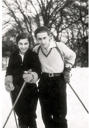
A hitves és a költő síelés közben

csodákban hittem s napjuk elfeledtem, bombázórajok húznak el felettem; szemed kékjét csodáltam épp az égen, de elborult s a bombák fönt a gépben zuhanni vágytak. Ellenükre élek, – s fogoly vagyok. Mindent, amit remélek fölmértem s mégis eltalálok hozzád; megjártam érted én a lélek hosszát,